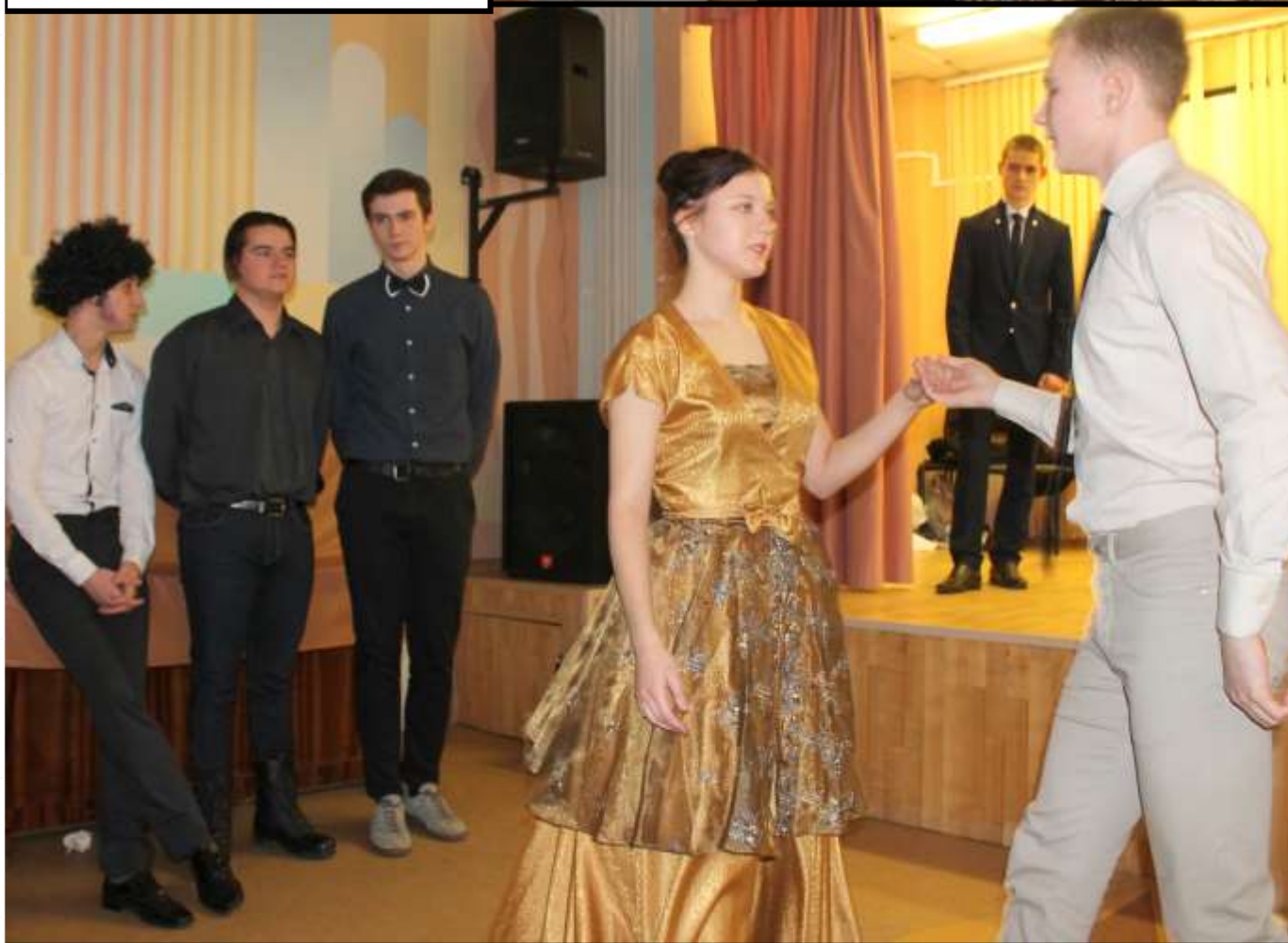
Дантес и Наталья Гончарова, жена Пушкина. Начало трагедии.