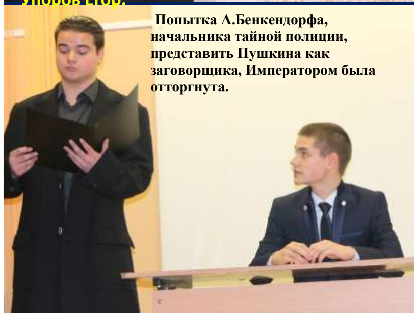
Попытка А.Бенкендорфа, начальника тайной полиции, представить Пушкина как заговорщика, Императором была отторгнута.